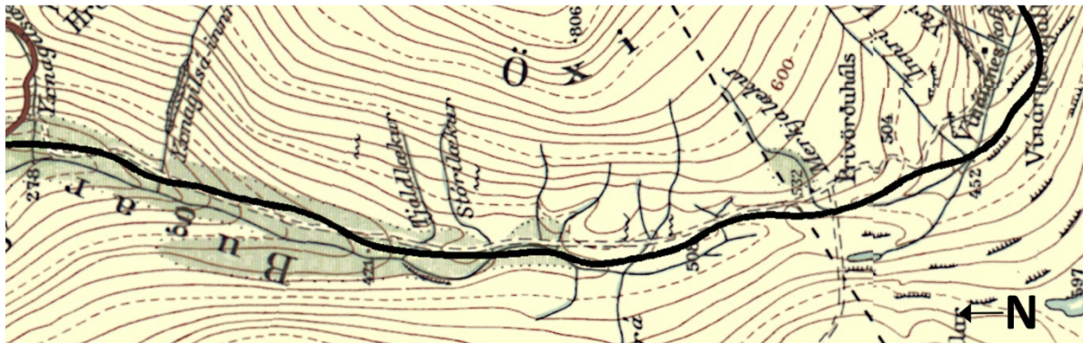
Mynd 6. Athugunarsvæðið á Öxi (Landmælingar Íslands 2003). Svarta línan sýnir gróflega staðsetningu nýs vegar um Öxi.

Engar heimildir fundust um snjóflóð á Öxi. Fyrir því kunna að vera ýmsar ástæður. Í fyrsta lagi er landslag á Öxi með þeim hætti að ekki eru miklar líkur á að flóð falli á vegarstæði (Mynd 6). Í öðru lagi hefur vegurinn ekki verið fær yfir vetrarmánuðina, nema síðustu ár og þá eru engin skráð flóð, eða flóð sem vitað er um (munlegar upplýsingar Reynir Gunnarsson og Guðni Nikulásson).