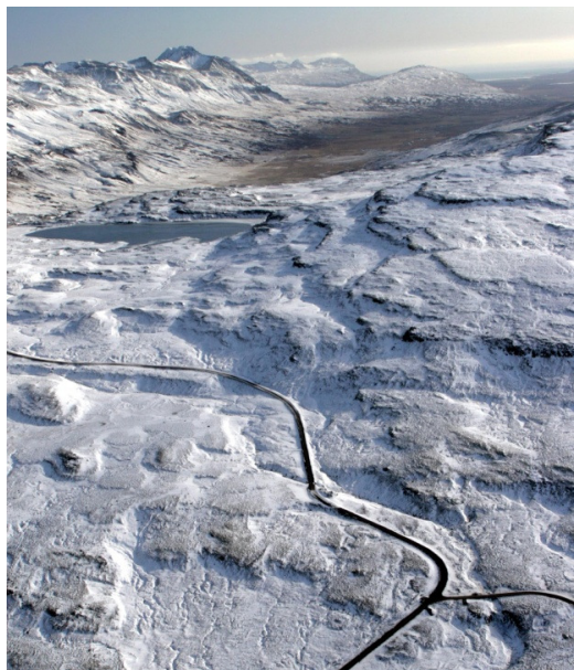
Mynd 3 Á Öxi.

Mjög bratt er svo þegar ekið er niður í Berufjarðarbotn og á stuttum kafla er 20% halli á veginum (Mynd 4, bls. 6) (Helga Aðalgeirsdóttir o.fl. 2008). Þær veglínur sem ná lengst í suður (veglínur B og D) og norður í dalnum (veglínur A, C og D) liggja sumstaðar undir bröttum hlíðum og gæti stafað hætta af ofanflóðum. M.a. í námunda við ána Hemru og ofan við Háöldu.