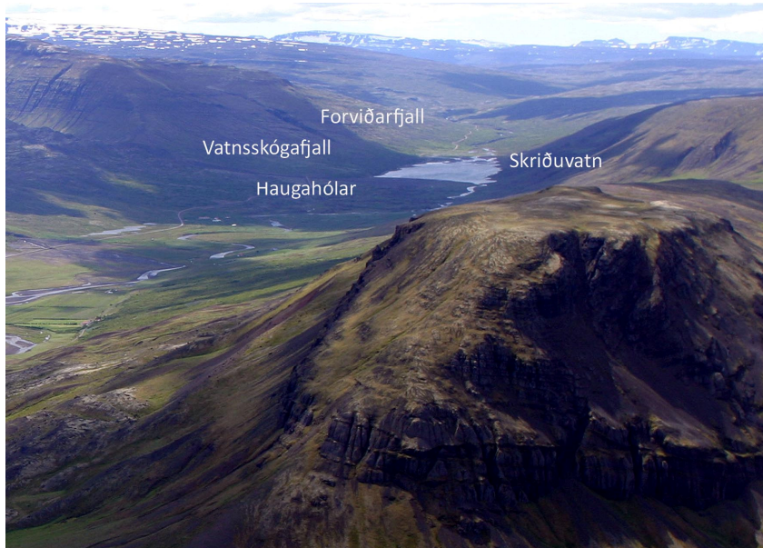
Mynd 2. Horft inn suðurdal Skriðdals í átt að Öxi

Hringvegurinn í Skriðdal liggur undir brattri hlíð Vatnsskógafjalls og Forviðarfjalls (Mynd 2). Þegar komið er á sjálfa Öxi er landslag ekki með þeim hætti að vegstæðinu stafi hætta af ofanflóðum (Mynd 3).