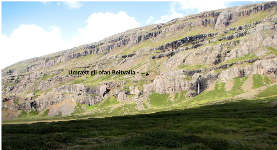
Mynd 8 Gil ofan Beitivalla.