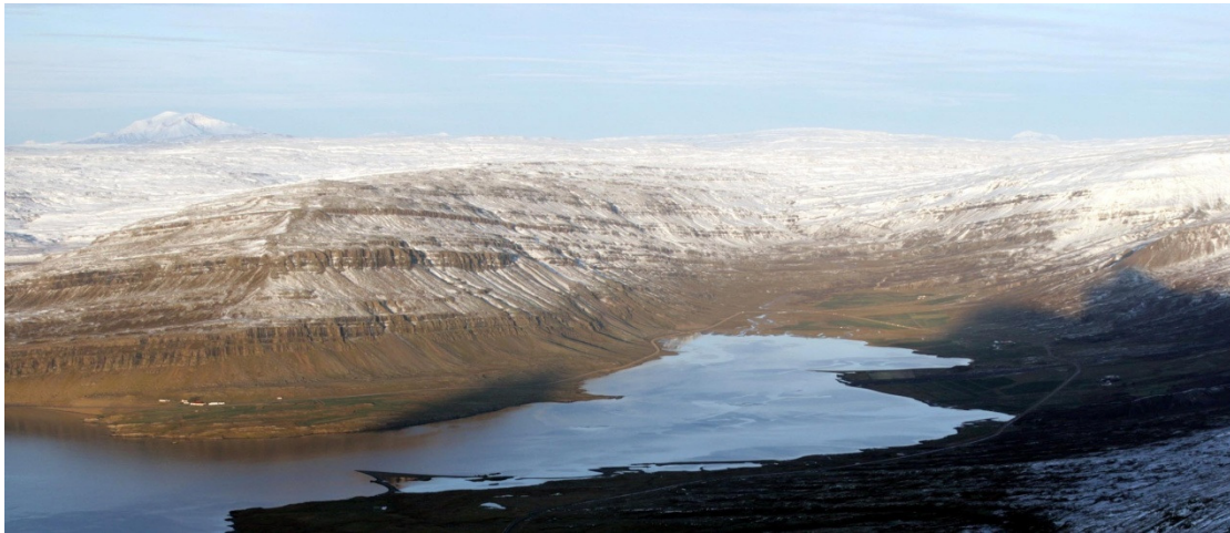
Mynd 4 Í Berufirði, horft inn botninn og upp á Öxi