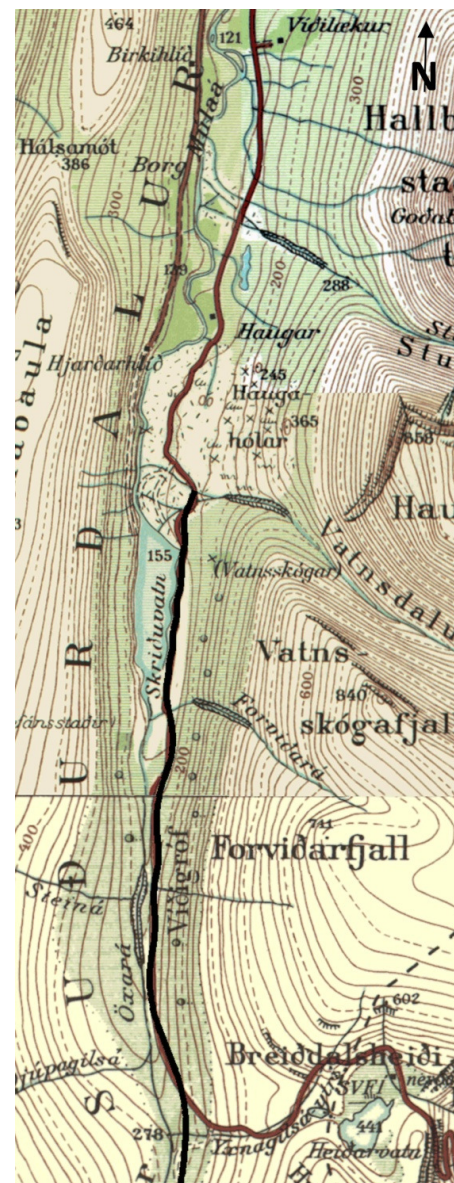
Mynd 5 Athugunarsvæðið í Skriðdal. Svarta línan sýnir gróflega staðsetningu nýs vegar (Landmælingar Íslands 2003)

Sérstæðasta landslagsmyndunin í dalnum eru hólarnir í landi Hauga (Mynd 5). Haugahólar eru myndað út tveimur framhlaupum úr Hallbjarnarstaðatindi og úr Haugafjalli. Hlaupið úr Haugafjalli er að líkindum um 4000 ára. Hlaupið úr Hallbjarnarstaðatindi gæti verið allt að 2900 ára gamalt, en hefur a.m.k. fallið fyrir 1392. Það gæti því hugsanlega verið hlaupið í Skriðdal sem getir er um í Landnámu þegar „hljóp ofan fjallið allt“ er Hrafnkell Freysgoði fór um dalinn (Árni Hjartarson 1990).