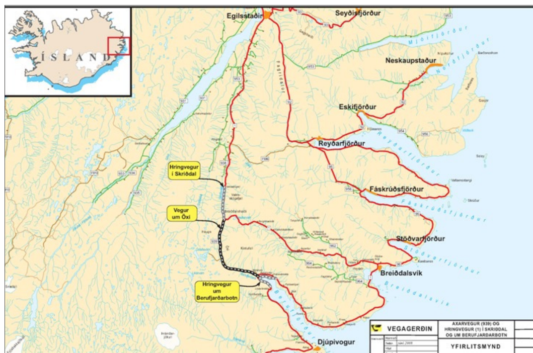
Mynd 1 Yfirlitsmynd af Hringvegi (1) í Skriðdal, Axarvegi (939) og Hringvegi (1) um Berufjarðarbotn (Helga Aðalgeirsdóttir o.fl. 2008)

Að beiðni Vegagerðarinnar hefur Náttúrustofa Austurlands safnað saman upplýsingum um ofanflóð á nýjum vegarstæðum á Axarvegi og Hringvegi frá Skriðuvatni í Skriðdal um Öxi í botn Berufjarðar.